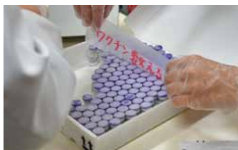
他医療機関へワクチンの払出準備