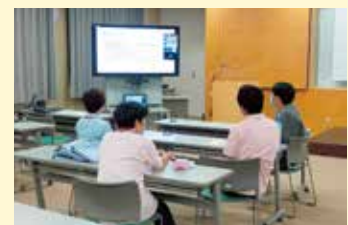
静岡大学とのミーティングの様子

優しさを伝えるケア技術として「ユマニチュード®」を全職員で学んでいます。静岡大学情報学部の方々とは、客観的に普段のケアを捉え直すために、ケアの映像を撮影して、振り返りシートを作成、映像を分析(見える化)し、数値化。自分の強みと弱みを知り、仲間の映像を見ることで適切なコーチングにつなげ、QOLの向上を図ることを目的に、共同研究を継続的に