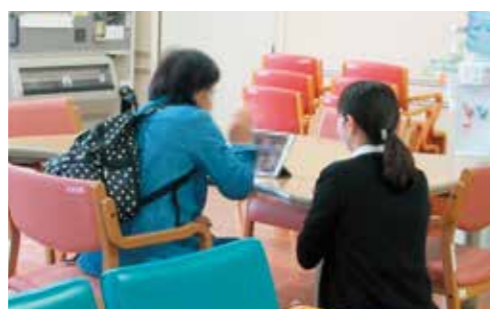
テレビ面会の様子