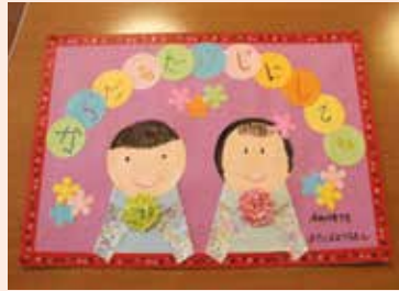
園児からのサプライズプレゼント

新型コロナウイルス感染症の拡大又はまん延防止により、地域との交流がほぼ中止となる中、患者様やご利用者の生活を豊かにするため、今回初めて市内富久山町にある双葉幼稚園、年長組の皆さんの協力を得て、「オンライン交流会」を実現しました。 交流会では女の子がダンスを披露、男の子は跳び箱を披露してくれました。さらに子どもたちから「好きな食べ物は何ですか?」「好きな色は何ですか?」「好きな昆虫は何ですか?」と質問が寄せられ、患者様もみんなで回答し、短い時間でしたが、小さな子どもたちと交流ができたことで素敵な笑顔がいっぱい時間を過ごしました。