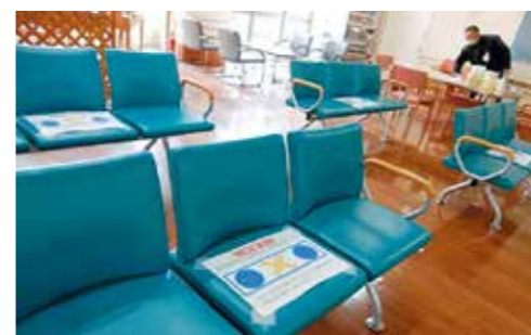
環境整備・定時消毒の様子