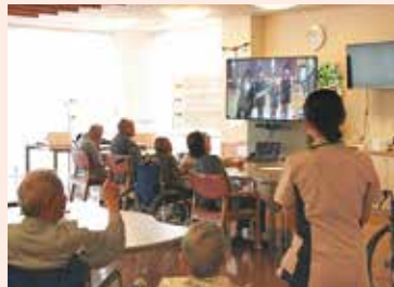
デイルームで幼稚園とオンライン交流