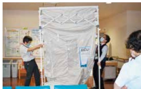
空気感染隔離ユニット設置の様子