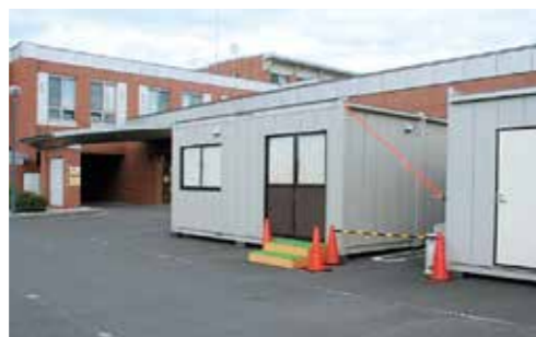
西口玄関・発熱外来設置