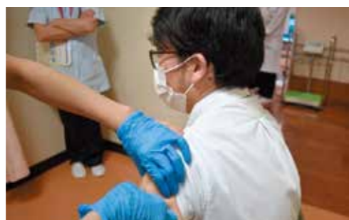
コロナワクチン優先接種（職員）の様子