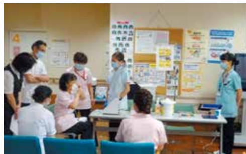
マスクフィッティングテストの様子