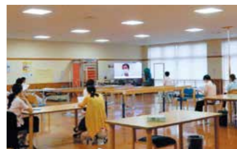
院内におけるオンライン研修の実施