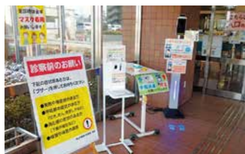
サーモカメラ・自動アルコール噴霧器設置