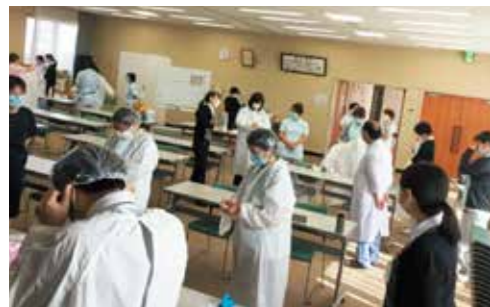
感染防護具着脱研修（全職員）