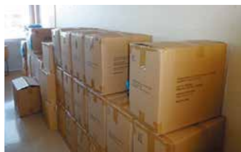
感染対策の支援物資