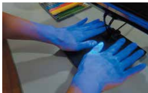
衛生的な手洗い研修の様子