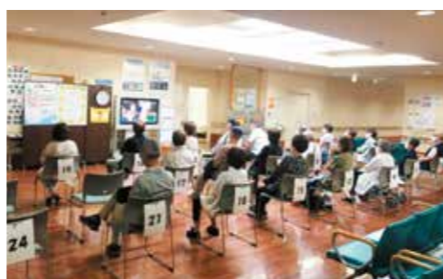
コロナワクチン接種（高齢者）の様子