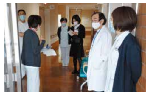
外来患者様の動線検討