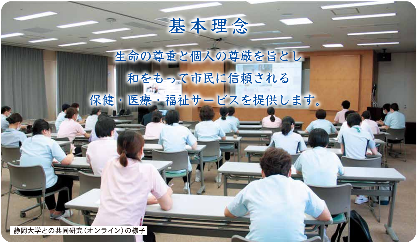
静岡大学との共同研究(オンライン)の様子

生命の尊重と個人の尊厳を旨とし 和をもって市民に信頼される 保健・医療・福祉サービスを提供します。