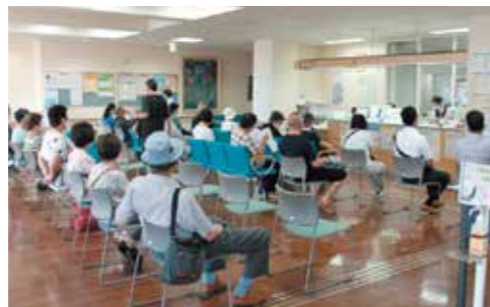
コロナワクチン集団接種（職域）