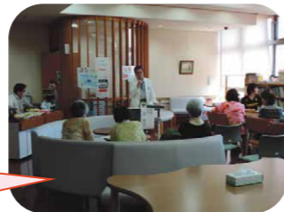
ビッグハートカフェの様子です。