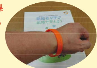
認知症サポーターの印「オレンジリング」です。受講した方は郡山市からいただけます。