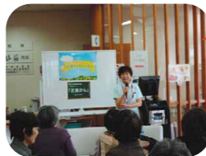
オレンジカフェの様子です。