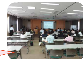
認知症サポーター養成講座の様子です。

こおりやまオレンジカフェ・ビッグハートは郡山市の委託事業で、市内で3番目にオープンしたオレンジカフェになります。平成27年10月1日から委託を受けて、毎月1回玄関ホールのオープンスペースで開催しています。国では「新オレンジプラン」という認知症施策をすすめています。新オレンジプランの基本的考え方は「認知症の人の意志が尊重され、できる限り住み慣れた地域のよい環境で自分らしく暮らし続けることができる社会の実現を目指す。」というものです。このプランには様々な施策が盛り込まれていますが、そのひとつに「認知症カフェ」があります。認知症カフェは元々はイギリスやオランダで生まれたアイデアのようですが、認知症の人やその家族、地域にも良い影響があるとされています。認知症カフェでは認知症の本人や家族、地域の皆様、専門職などが自由に集い、交流や意見交換などを行う「カフェ」形式の場です。