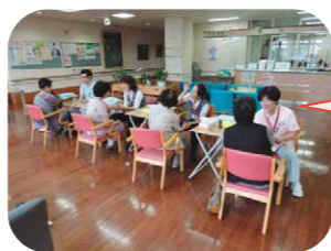
大好評のハンドマッサージコーナー。