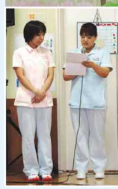
(右) 実行委員長 (左) 司会者